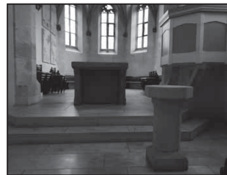
Ein bisschen wehmütig war dann doch die Stimmung, als der Altar abgedeckt wurde: Tauf- und Abendmahlsgerichte wurden aus der Kirche getragen, die

Bibel wurde zugeschlagen und verließ die Kirche. Blumen und Kerzen wurden entfernt und das Kreuz musste umziehen. Die Kanzel und der Altar sind ohne Decken und Paramente zurückgeblieben.